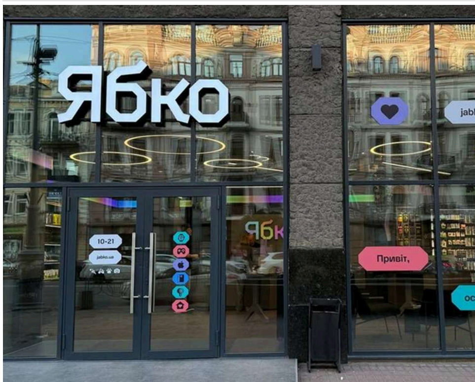
Суд підтвердив штраф у 347 тисяч гривень для мережі «Ябло» за торгівлю iPhone без обліку