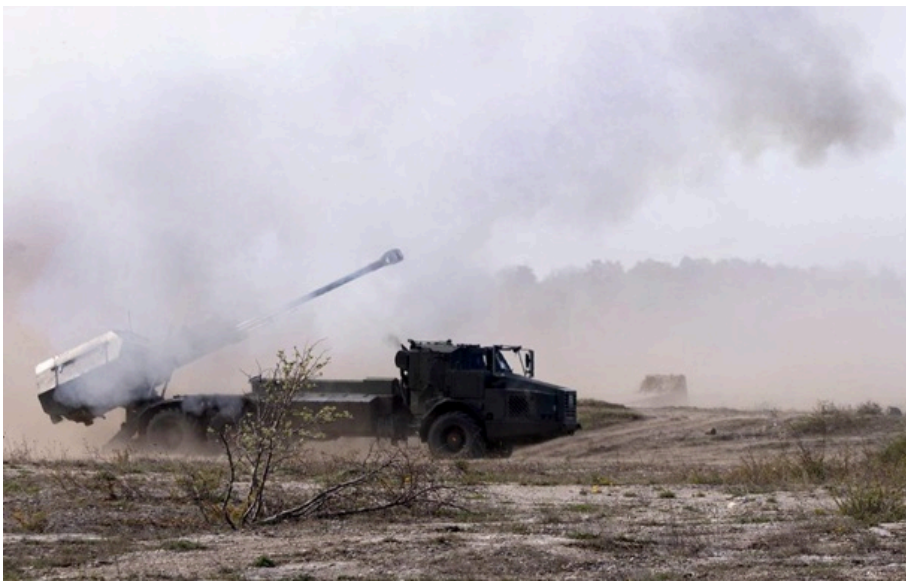
На Куп'янському напрямку ворог атакував один раз у бік Новоплатонівки