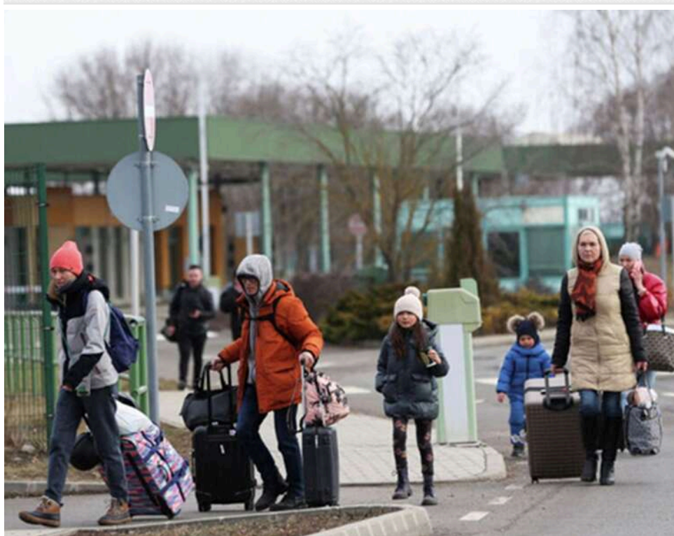
Влада Молдови розробила сценарії реагування на випадок нової хвилі біженців з України

Документ описує планові «гіпотетичні» сценарії, розроблені для підготовки до заходів реагування. Вони не передбачають автоматичного оголошення надзвичайного стану або введення інших екстрених заходів.