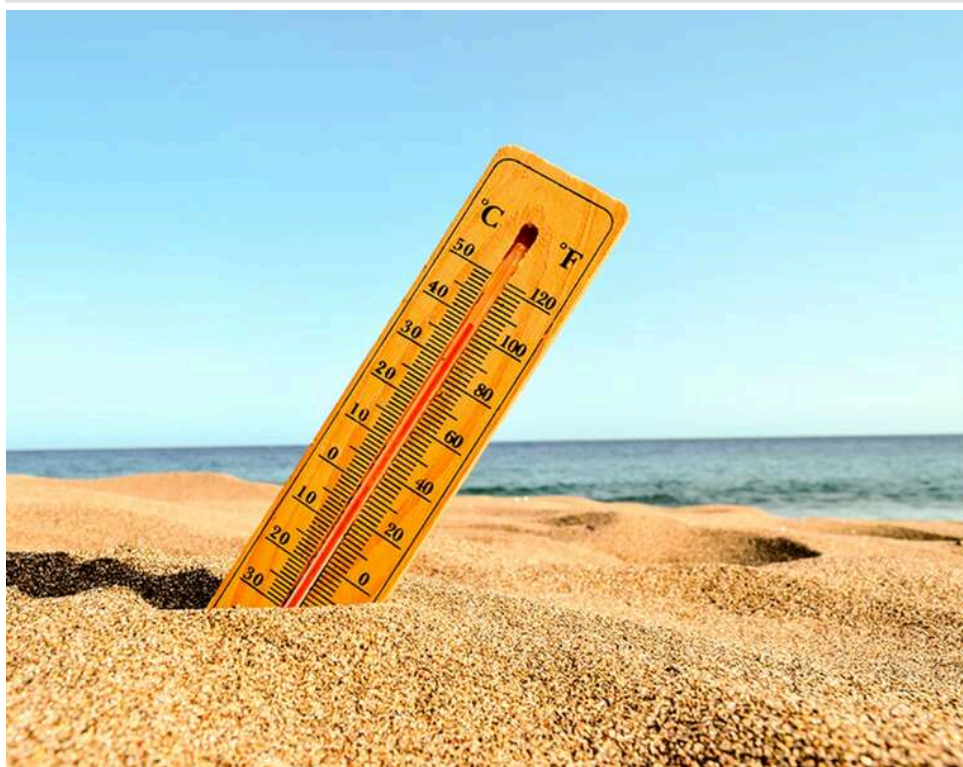
Загроза супер Ель-Ніньо: У найближчі місяці вчені очікують екологічну катастрофу

Кліматологи попереджають про небезпеку: незабаром планета може зіткнутися зі супер Ель-Ніньо – надзвичайно потужним кліматичним феноменом, який спровокує безпрецедентну спеку, масштабні повені та інші погодні відхилення по всьому світу. За їхніми прогнозами, це явище може стати одним з найінтенсивніших за всю історію спостережень.