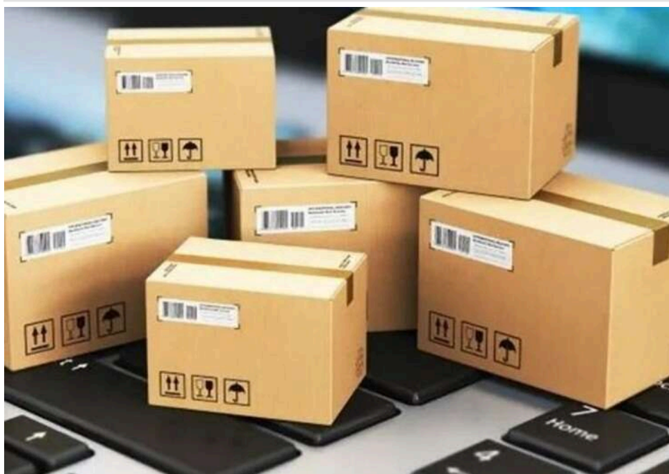
Комітет ВР схвалив законопроект про оподаткування міжнародних відправлень

В Україні схвалили до голосування законопроект, який передбачає скасування пільги на посилки до 150 євро та введення 20% ПДВ на більшість міжнародних відправлень. Нові правила можуть почати діяти з 2027 року та суттєво змінять вартість онлайн-покупок із-за кордону. Водночас рішення є черговим "маяком" для співпраці з Міжнародним валютним фондом (МВФ) і має принести бюджету мільярдні надходження.