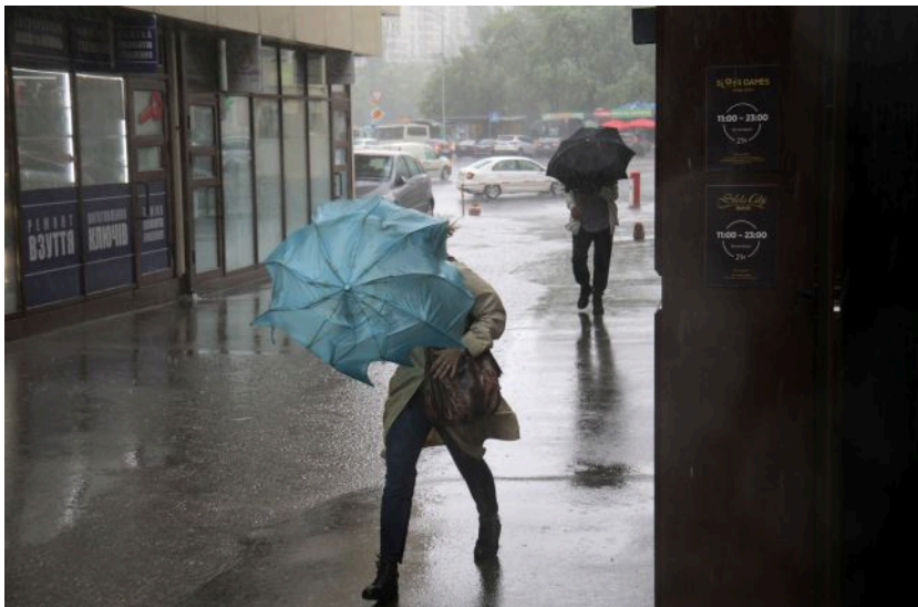
Фото: синоптики дали прогноз погоди на 13 травня