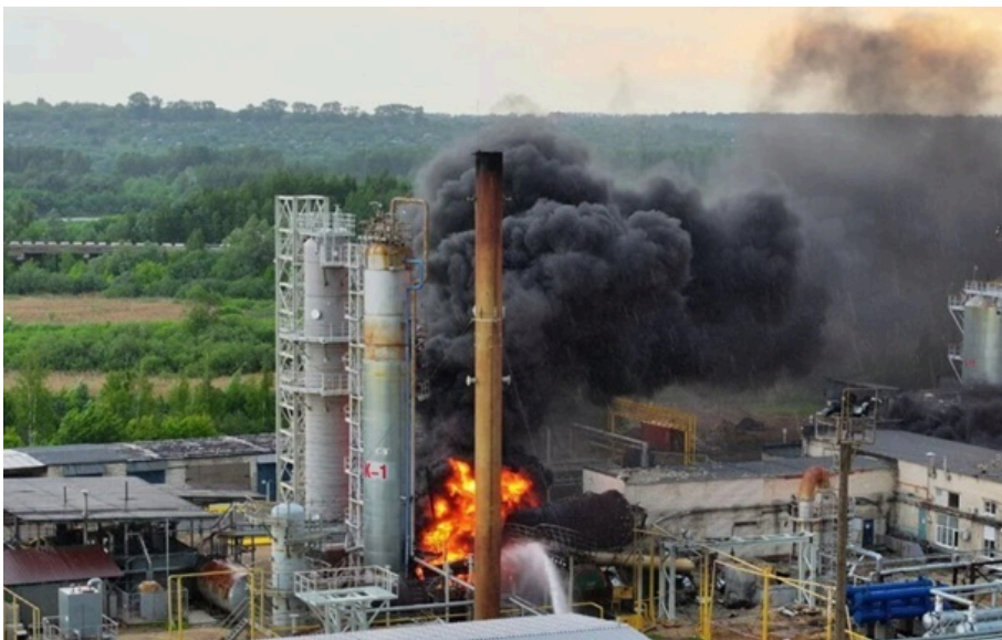
Підсумки 12.05

У Світловодській міськраді на Кіровоградщині сталася стрілянина; у Росії виник дефіцит бензину після ударів по НПЗ. Кореспондент.net виділяє головні події вчорашнього дня.