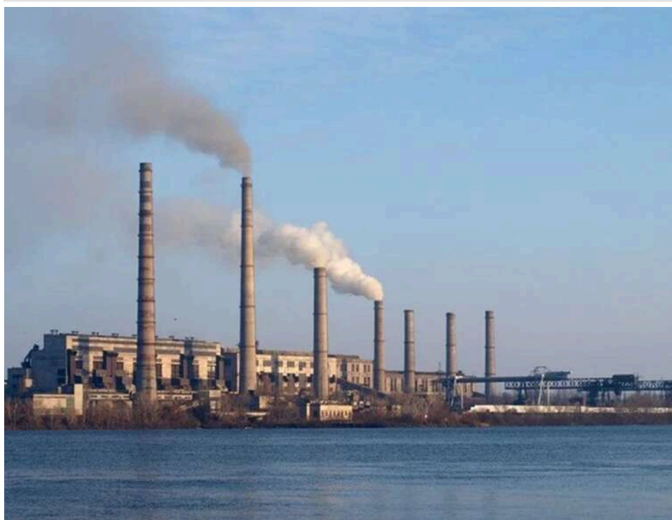
Тендер на Зміївській ТЕС: підрядник знизив ціну на 37%, щоб отримати контракт на 228 мільйонів

Зміївська ТЕС ПАТ «Центрэнерго» (м. Слобожанське, Чугуївський район, Харківська обл.) 1 квітня за результатами тендеру уклала угоду з ТОВ «Спецтермомонтаж-Енерго» про механо-монтажні роботи на 228,00 млн грн із ПДВ.