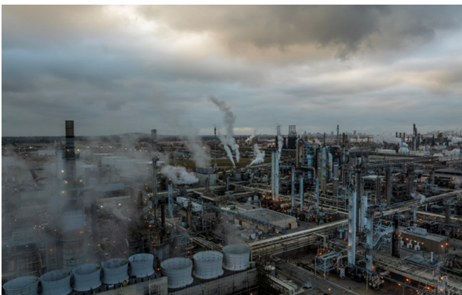
Удар по газу і нафті

Минулого року продажі електричних машин у Китаї зросли вчетверо порівняно з 2021 роком і перевищили продажі в усьому іншому світі.