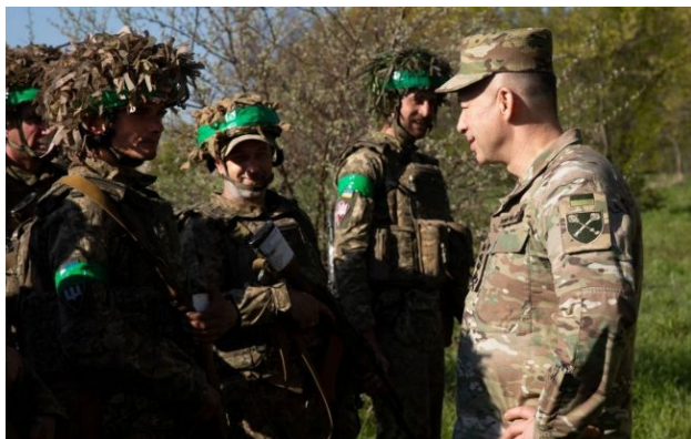
Фото: Сирський анонував посилення інструкторського складу (t.me/osirskiy)

Обирайте перевірене - додайте РБК-Україна до улюблених джерел у Google