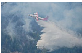
Карпати палають: у небі - літак, до гасіння