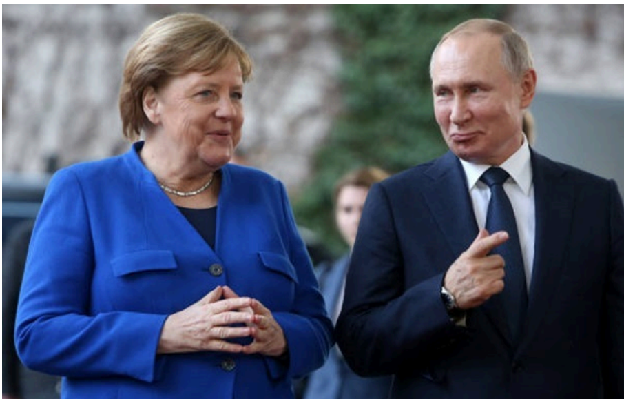
Ангела Меркель та Путін

Кандидатуру ексканцлерки Німеччини Ангели Меркель дедалі активніше обговорюють на роль посередника з Росією.