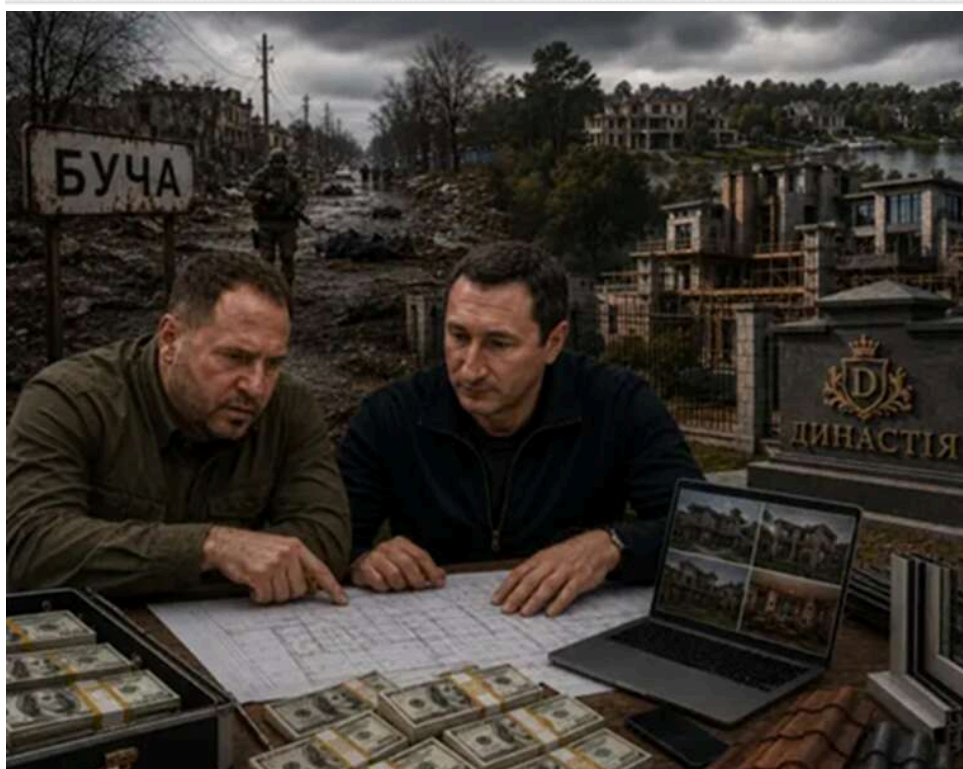
Будували під обстрілами: НАБУ оприлюднило плівки, де Чернишов вимагав прискорити зведення маєтків під час боїв за Київ

Фінансування будівництва маєтків у кооперативі "Династія" під Києвом розпочалося в червні 2021 року. Після початку повномасштабного вторгнення Росії в Україну в лютому 2022 року роботи в Козині продовжувалися. Зокрема, колишній віцепрем'єр-міністр Олексій Чернишов, який фігурує у справі "Мідас" як "Че Гевара", нібито вимагав будувати швидше і працювати в кілька змін – з ранку до пізнього вечора.