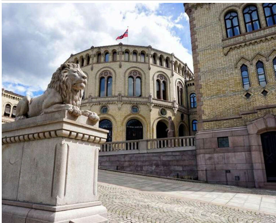
Мільйони доларів на пошук правди: Норвегія виділила кошти на роботу комісії у справі Епштейна

Норвезька комісія з розслідування справи американського фінансиста Джеффри Епштейна, засудженого за сексуальні злочини, отримає приблизно $2,4 млн на фінансування.