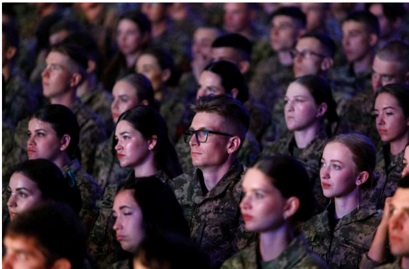
Фото: Випускники військового ВНЗ