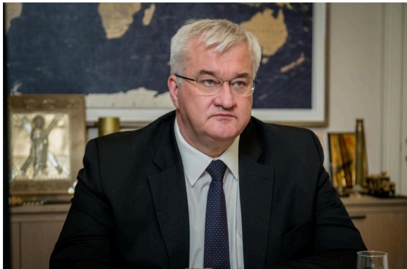
Фото: Андрій Сибіга, міністр закордонних справ України (facebook.com andrij.sybiha)