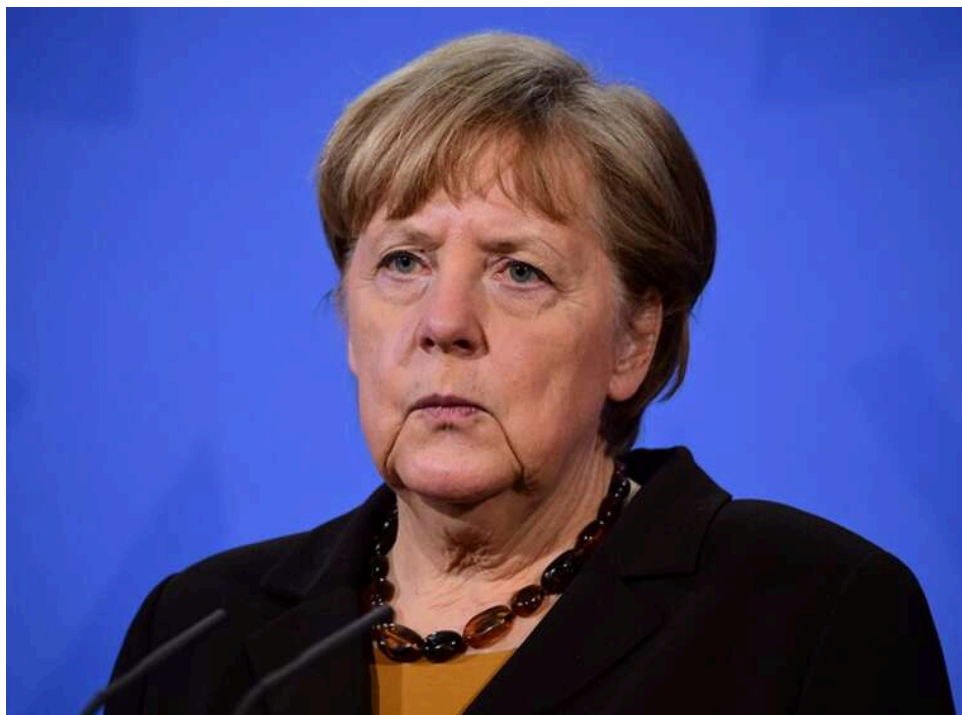
Меркель замість Шредера: у ЄС обговорюють повернення ексканцлерки як переговорника з Кремлем

Європа відчайдушно шукає шляхи прямого впливу на Кремль, не залежачи від непередбачуваного посередництва Вашингтона. У кулуарах Брюсселя та Берліна для відновлення діалогу основною фігурою вважається ексканцлерка Ангела Меркель.