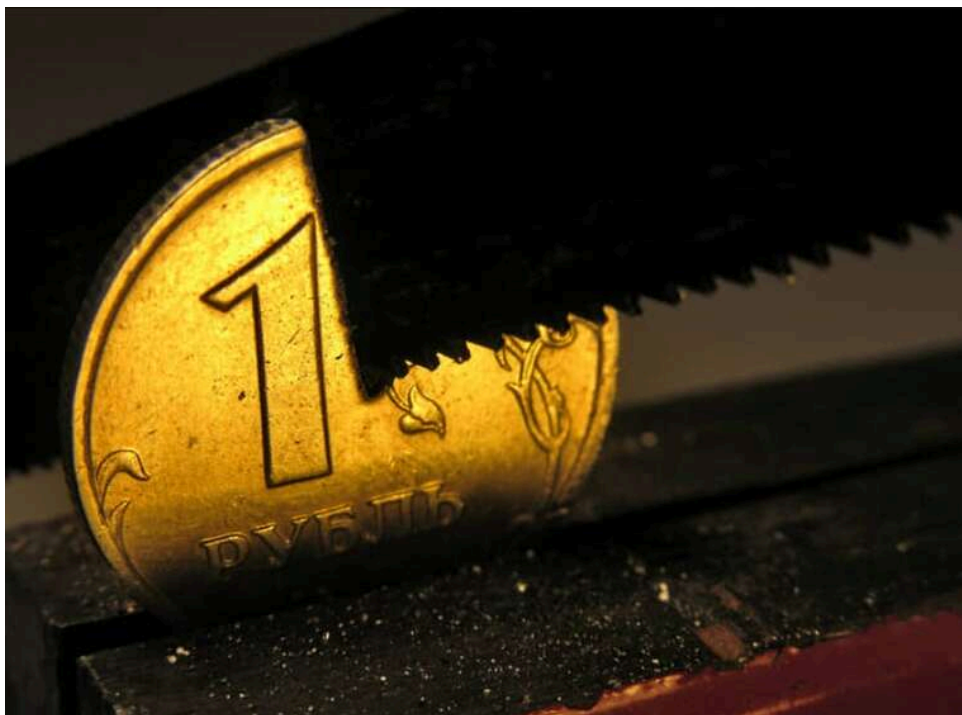
Bloomberg: Росія вперше за рік поповнила Фонд національного добробуту на тлі зростання цін на нафту

Росія вперше майже за рік внесла кошти до свого Фонду національного добробуту – це сталося завдяки зростанню цін на нафту на тлі війни з Іраном.