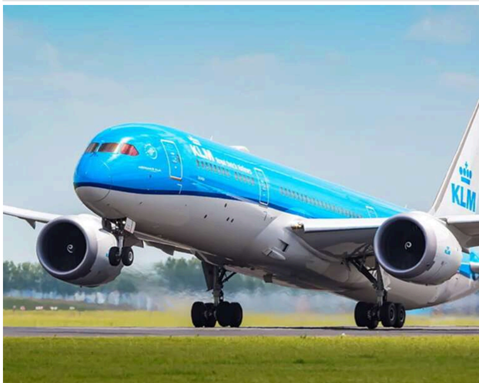
Невдалий жарт із назвою Wi-Fi: рейс KLM із Малаги затримали через мережу зі словом «бомба»