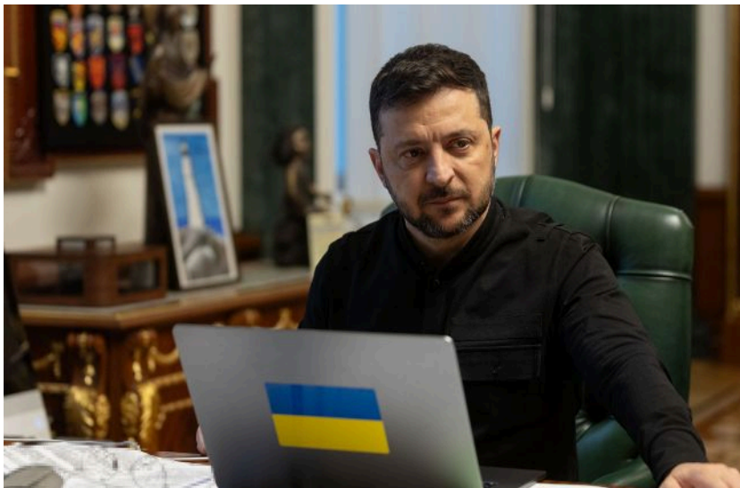
Фото: президент України Володимир Зеленський