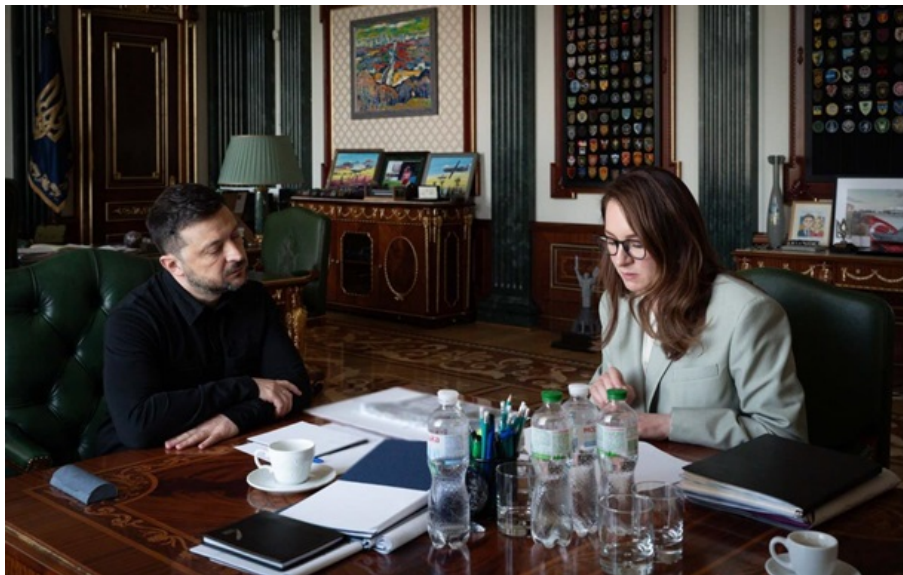
Зеленський і Свириденко під час наради 6 травня

Також повинно бути оперативно проведене і перезавантаження визначених державних підприємств.