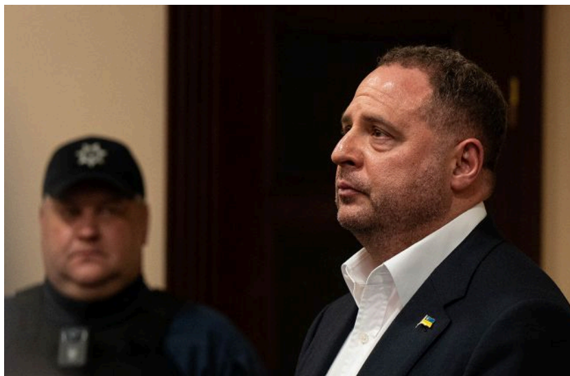
Фото: Андрій Єрмак перед початком судового засідання (Getty Images)

Обирайте перевірене - додайте РБК-Україна до улюблених джерел у Google