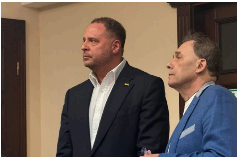
Фото: Андрій Єрмак перед початком судового засідання