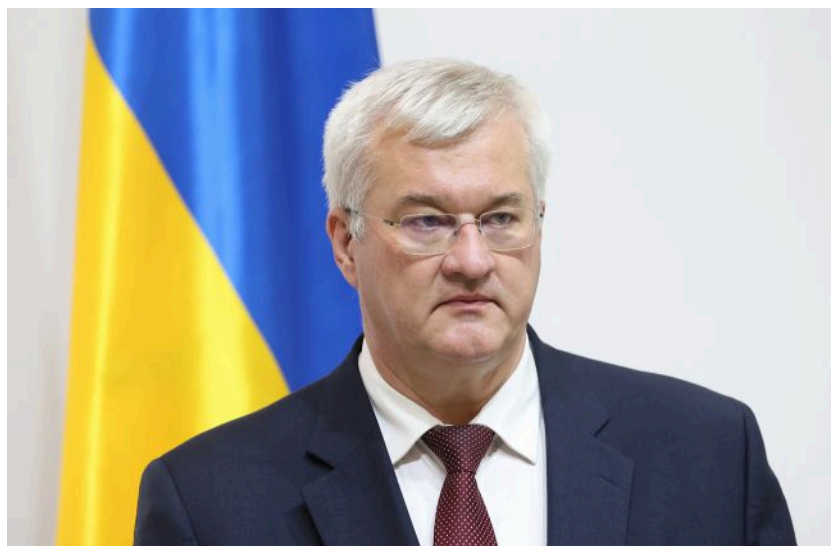
Фото: Андрій Сибіга, міністр закордонних справ України (Getty Images)