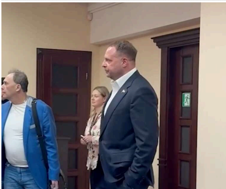
«R2» – це Андрій Борисович: прокурорка САП пояснила, як у справі «Мідас» ідентифікували Єрмака