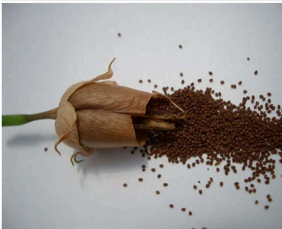
«Тютюновий пояс» на 230 тисяч: на Закарпатті судили жінку, яка намагалася пронести елітне насіння під одягом