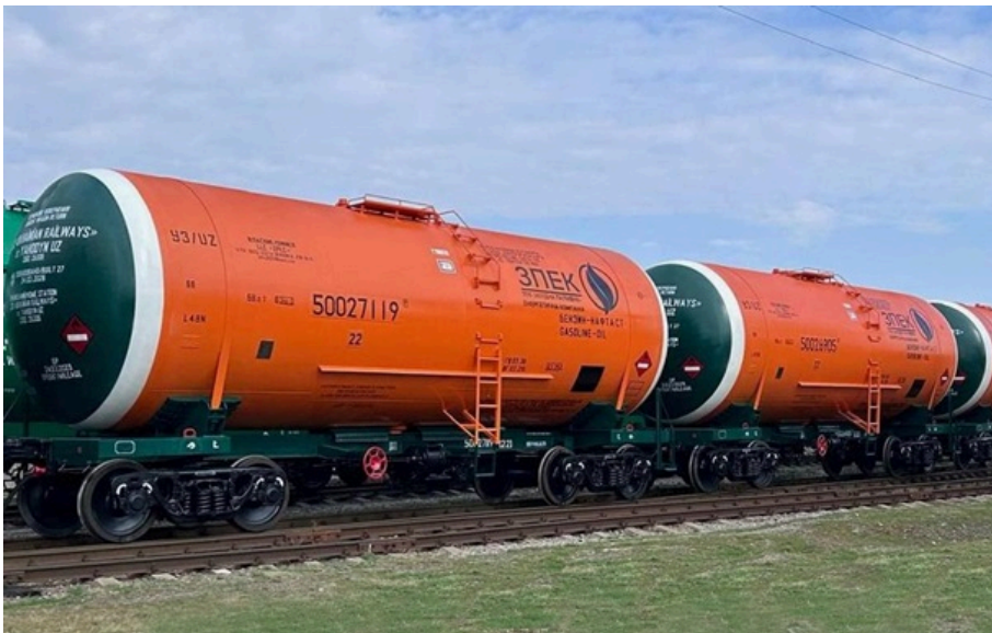
Перші виготовлені вагони-цистерни для ЗПЕК