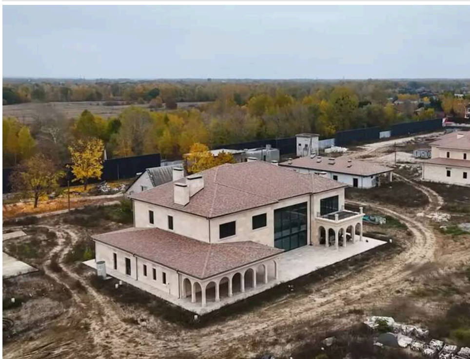
Справа на сотні мільйонів: як оточення Єрмака, Міндіча та Чернишова буде «Династією» на крадених ресурсах

Елітне котеджне містечко «Династія», яке пов'язують з оточенням Андрія Єрмака, Тимура Міндіча та Олексія Чернишова, опинилося в центрі нового скандалу. Йдеться не лише про можливу легалізацію сотень мільйонів гривень, а й про використання піску, незаконно вивезеного з території кладовища.