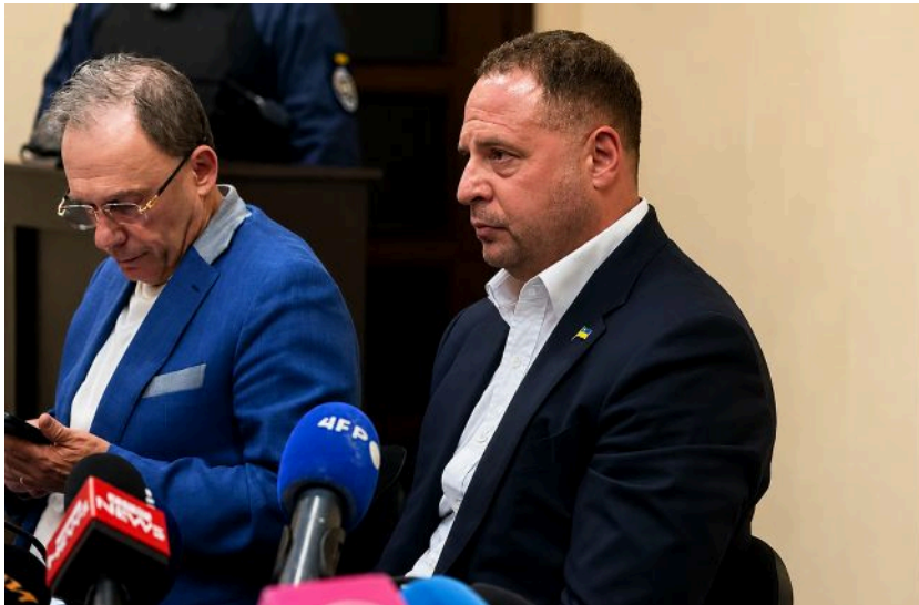
Андрій Єрмак, экс-голова Офісу президента