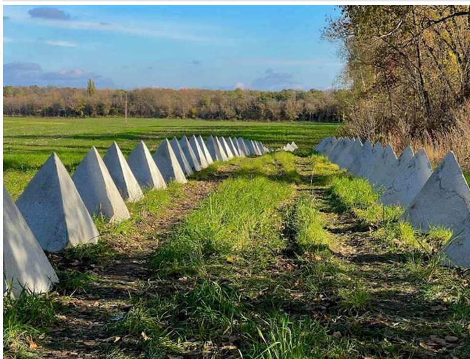
Мільярди в землю: як «вертикаль Кіпера» та івано-франківські куратори освоювали гроші на одеських фортифікаціях

Історія з фортифікаціями в Одеській області продовжує перетворюватися на одну з найтоксичніших і потенційно найнебезпечніших тем для Одеської ОВА. І що більше спливає деталей, тим менше це схоже на хаос і тим більше – на системну фінансову конструкцію.