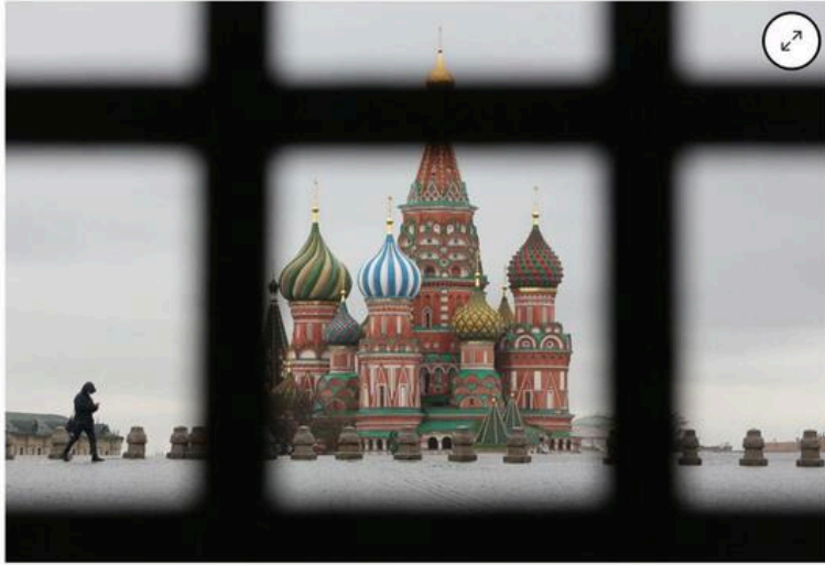
The Red Square near the Kremlin in Moscow.