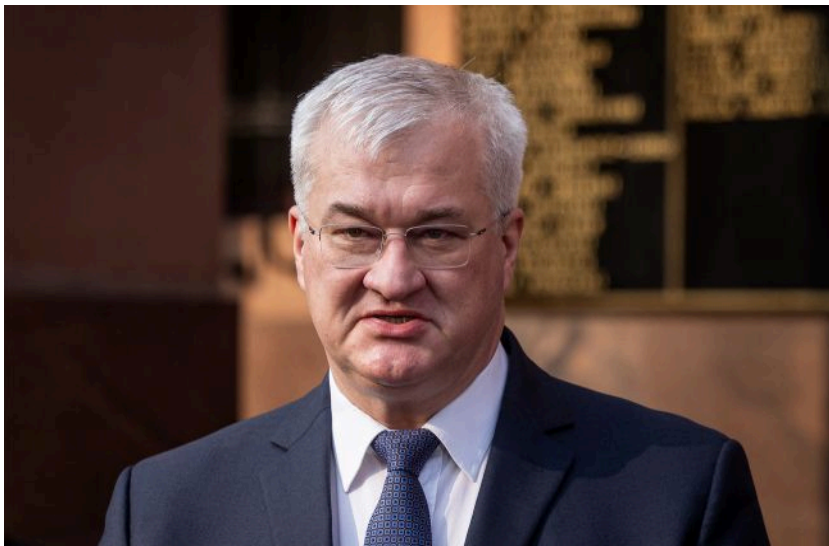
Фото: Андрій Сибіга, міністр закордонних справ України (Getty Images)