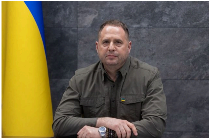
Фото: Андрій Єрмак (Віталій Носач, РБК-Україна)