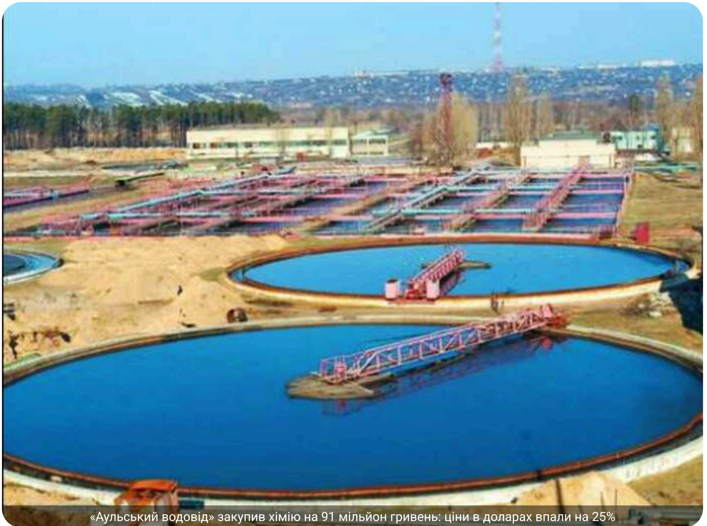
«Аульський водовід» закупив хімію на 91 мільйон гривень: ціни в доларах впали на 25%

КП «Аульський водовід» Дніпропетровської обласної ради 30 квітня за результатами тендеру замовило ТОВ «Гідрохім» хімії на для очищення води 90,65 млн грн.