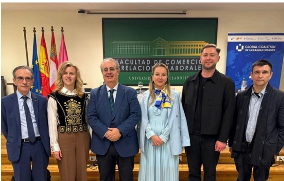
Український тиждень в Іспанії ініціювала Глобальна коаліція українських студій, що діє під патронатом першої леді України

Глобальна коаліція українських студій нині об'єднує 77 учасників з 26 країн, іще 130 іноземних інституцій планують приєднатися.