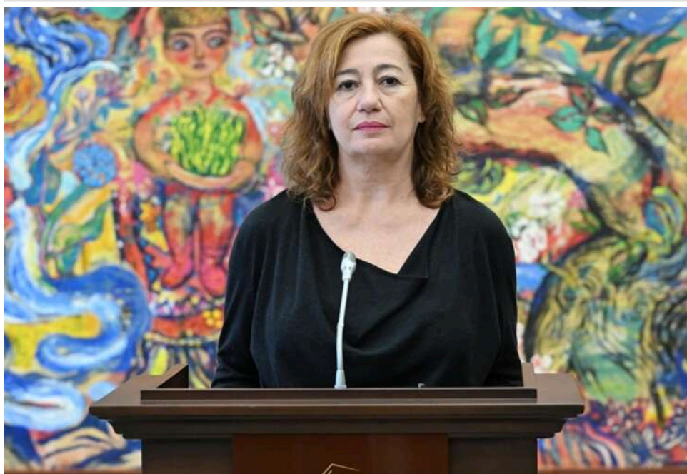
Голова Конгресу Іспанії у Верховній Раді: «Ми супроводжуватимемо Україну на всьому шляху до ЄС»

Україна повинна наполегливо працювати, щоб перспектива вступу до Європейського Союзу стала реальністю.