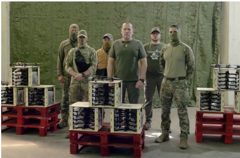
"Українська команда" передала дрони бійцям "Артану" (кадр із відео)