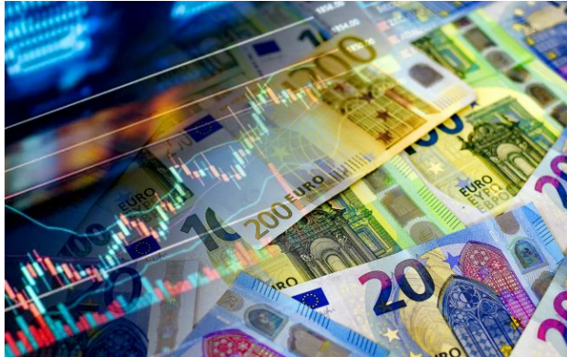
Фото: яким буде курс валют 21 квітня

Національний банк підвищив курс долара та євро на вівторок, 21 квітня. Європейська валюта вчергове встановила історичний рекорд.