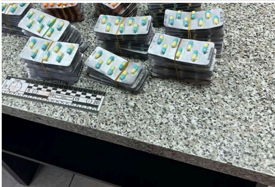
Сировина для «айсу» під виглядом ліків: як через український кордон масово завозять прекурсори з Єгипту

Українські суди розглядають щорічно сотні практично ідентичних адміністративних справ про порушення митних правил. У кожній з них фігурують одні й ті ж препарати єгипетського виробництва, що містять псевдоефедрин – контрольований прекурсор, який використовується для виготовлення метамфетаміну – наркотик, знаний як айс.