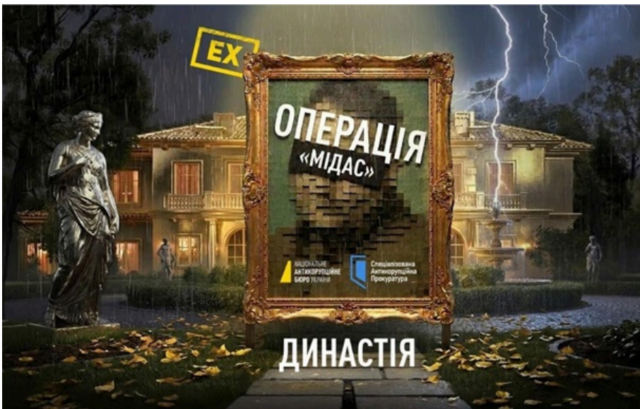
Котеджне містечко Династія будували в Козині під Києвом.

Будівництво котеджів здійснювалось через житлово-будівельний кооператив, підконтрольний колишньому віцепрем'єр-міністру.