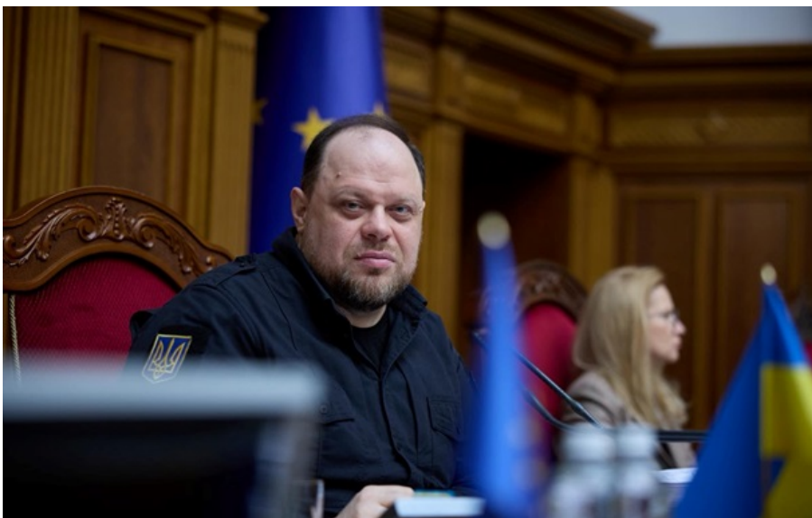
Руслан Стефанчук спростував "міфи" про Цивільний кодекс

Цивільний кодекс є доволі складним і найбільшим законодавчим актом. І, безперечно, ця складність породжує велику кількість міфів, заявив Стефанчук.