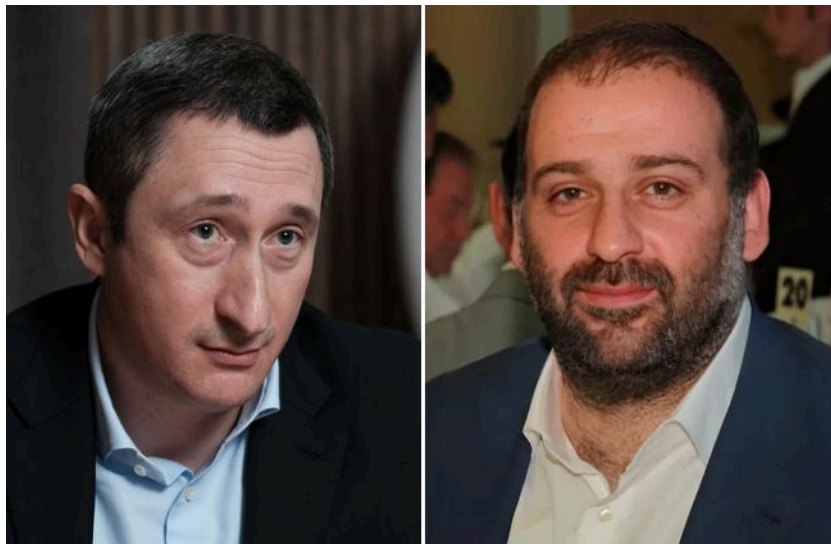
Фото: колишній віце-прем'єр України Олексій Чернишов та бізнесмен Тімур Міндіч (колаж РБК-Україна)

На порозі бунту? Чому російські еліти і суспільство перестали вірити Путіну