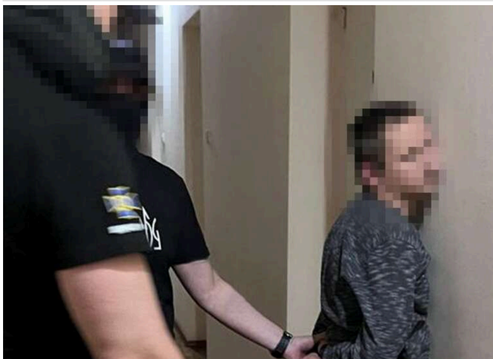
Посадовця Херсонської міськради затримали за схему «відкатів» на обслуговуванні Starlink у дитсадках

Посадовця Херсонської міськради підозрюють у вимаганні «відкатів» за обслуговування "старлінків" для садочків та інших комунальних установах міськради.