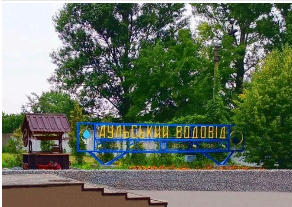
«Аульський водовід» замовив хімії для очищення води на 90 мільйонів: тендер перевіряє Держаудитслужба

КП «Аульський водовід» Дніпропетровської обласної ради 30 квітня за результатами тендеру замовило ТОВ «Гідрохім» хімії на для очищення води 90,65 млн грн.