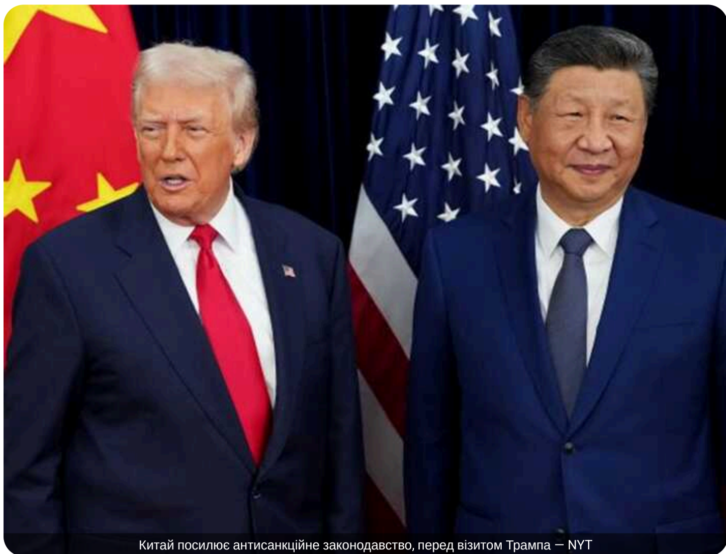
Китай посилює антисанкційне законодавство, перед візитом Трампа — NYT

Поки Трамп летить до Пекіна на переговори із Сі Цзіньпіном, обидві сторони паралельно готуються до тривалої економічної війни. Китай сигналізує, що більше не боїться ескалації і активно будує правовий арсенал для ударів у відповідь на американські санкції.