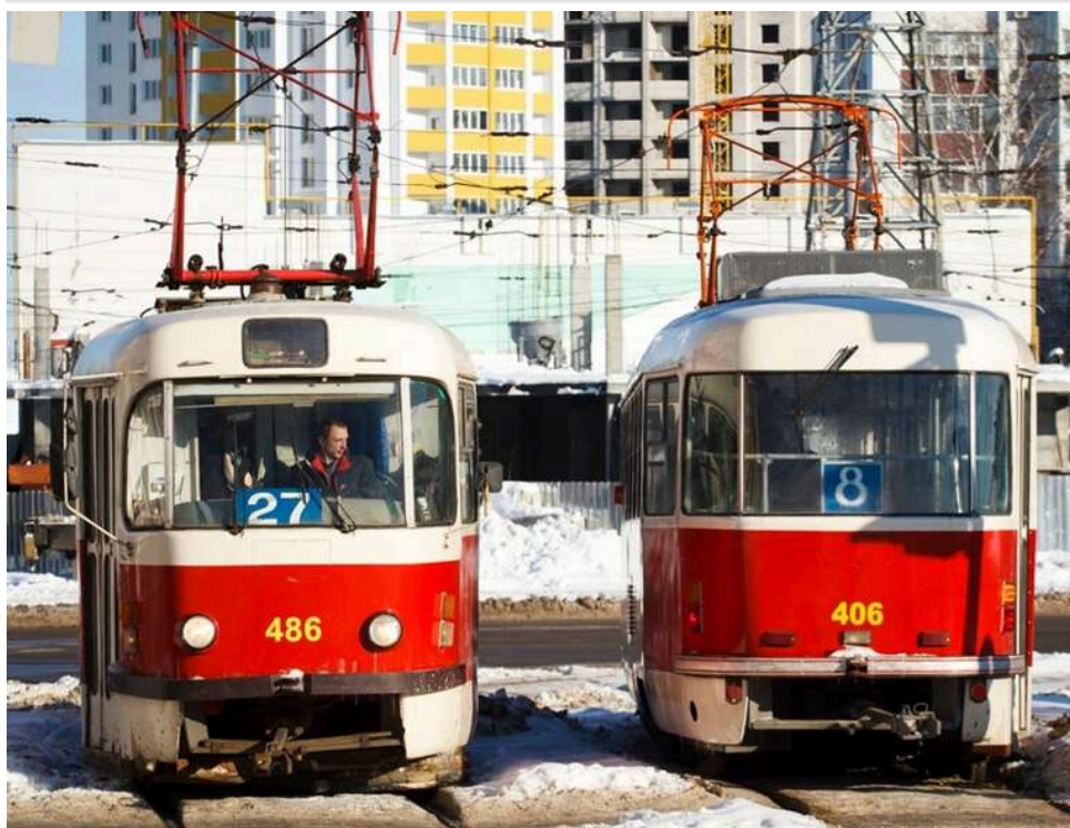
Золота оренда замість нових депо: Харків витратив мільйони на вживані чеські трамваї, що належать фірмам-фавориткам

Упродовж 15 років Харків замість купівлі нових трамваїв витрачає бюджетні мільйони на оренду старих вагонів у приватних компаній.