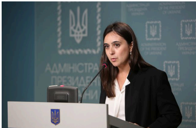
Фото: Юлія Мендель, колишня прессекретар президента