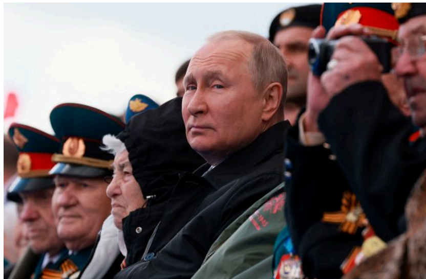
Фото: російський диктатор Володимир Путін на параді (Getty Images)