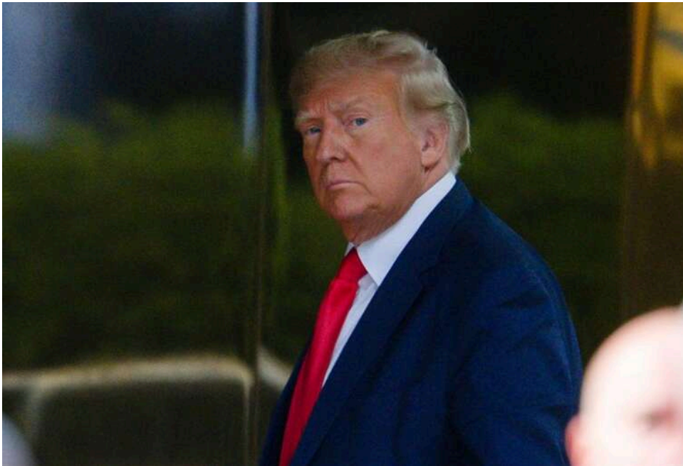
Мир в обмін на рейтинги: Дональд Трамп намагається заморозити війну в Україні до осінніх виборів у США

США ведуть перемовини з РФ щодо тимчасового припинення вогню перед осінніми виборами.