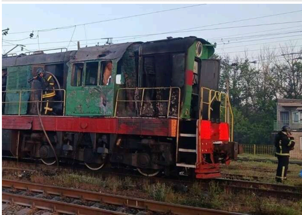
У Дніпропетровській області дрони атакували залізничну інфраструктуру: пошкоджено локомотиви

Вранці в Дніпропетровській області дрони завдали удару по об'єктах залізничної інфраструктури.