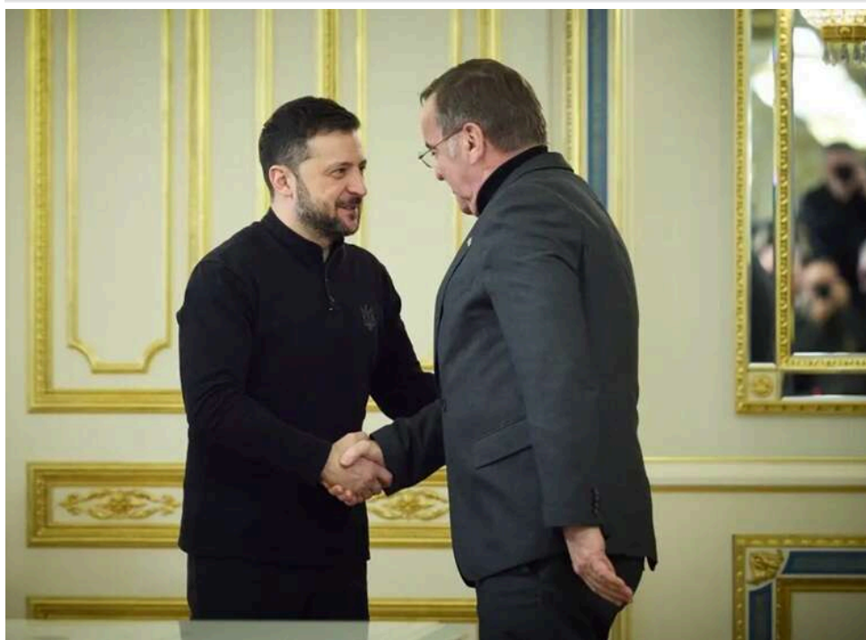
Спільна зброя та Drone Deal: Зеленський і Пісторіус домовилися про розвиток шести оборонних проєктів

Розвиток шести проєктів у сфері спільного виробництва зброї, підписання Drone Deal, підтримка ППО та енергетики – ключові теми зустрічі президента Володимира Зеленського з міністром оборони Німеччини Борисом Пісторіусом.